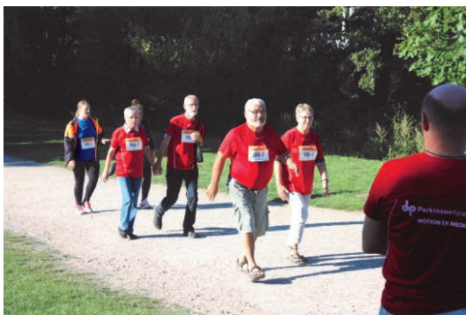
Foto fra DHL Stafetten Odense 2016