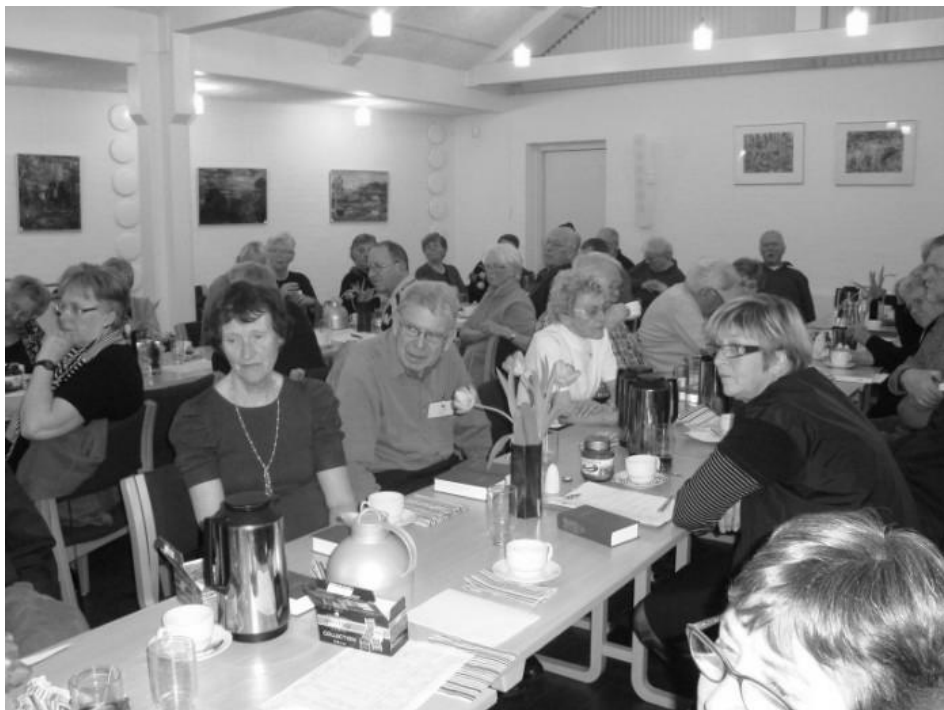
Deltagere ved årets generalforsamling i Fynskredsen

Et medlem havde dårlige erfaringer med et ophold på Montebello, hvor man var blevet mødt af uforberedte medarbejdere, som ikke vidste, hvad det drejede sig om. Opholdet havde derfor været en klar skuffelse for holdet. Landsformanden virkede overrasket, og undersøger sagen.